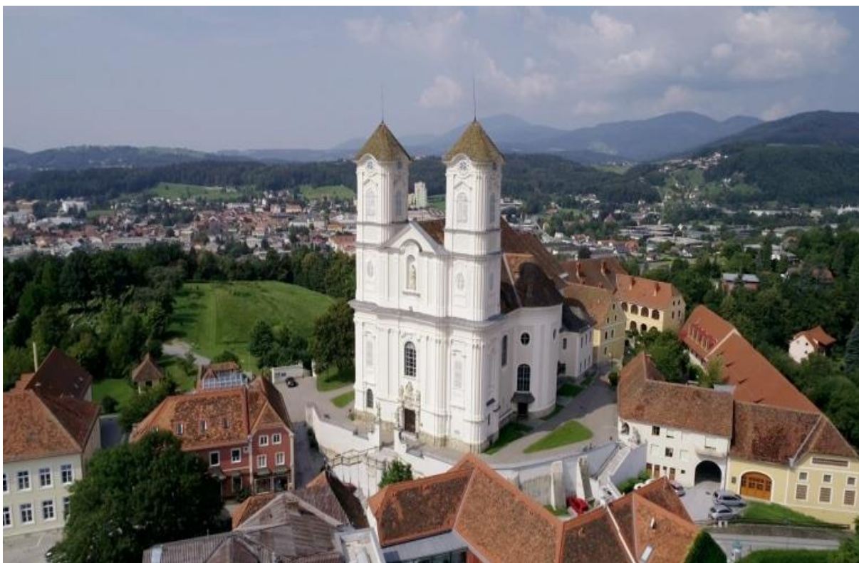
Wallfahrtsbasilika am Weizberg