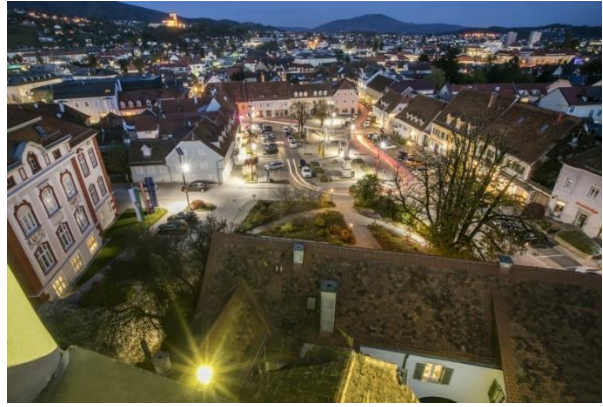
Stadtbesichtigung oder -bummel in der Bezirksstadt Weiz