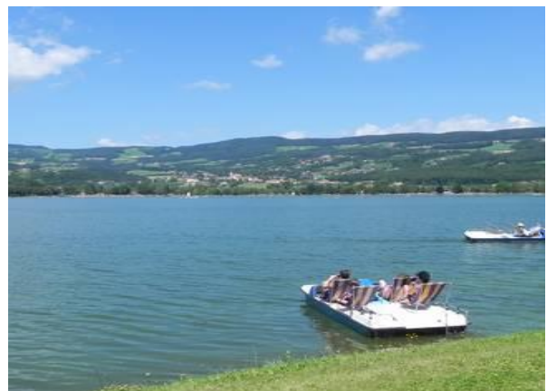
Baden oder Spaziergang am Stubenbergsee