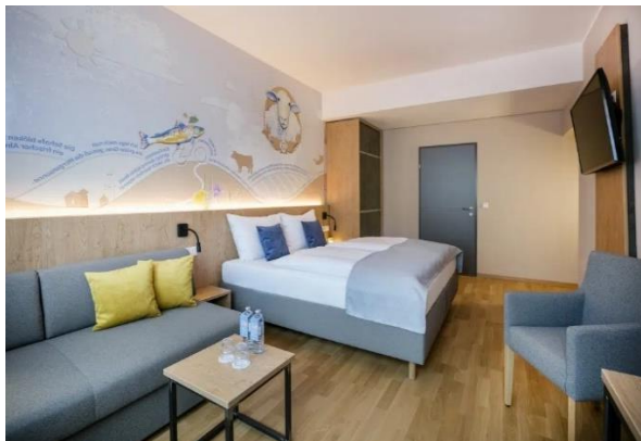
Jufa-Hotel in Weiz