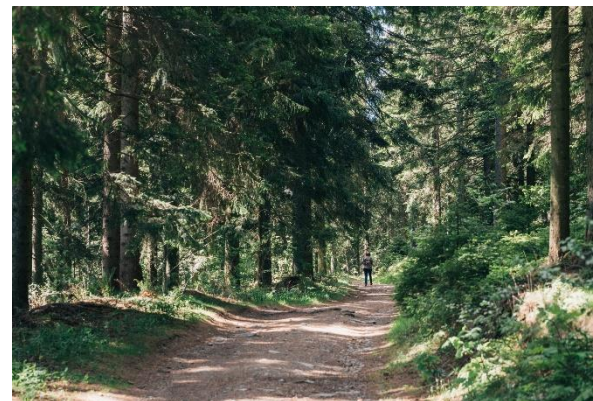
Wanderung auf der Brandluckn